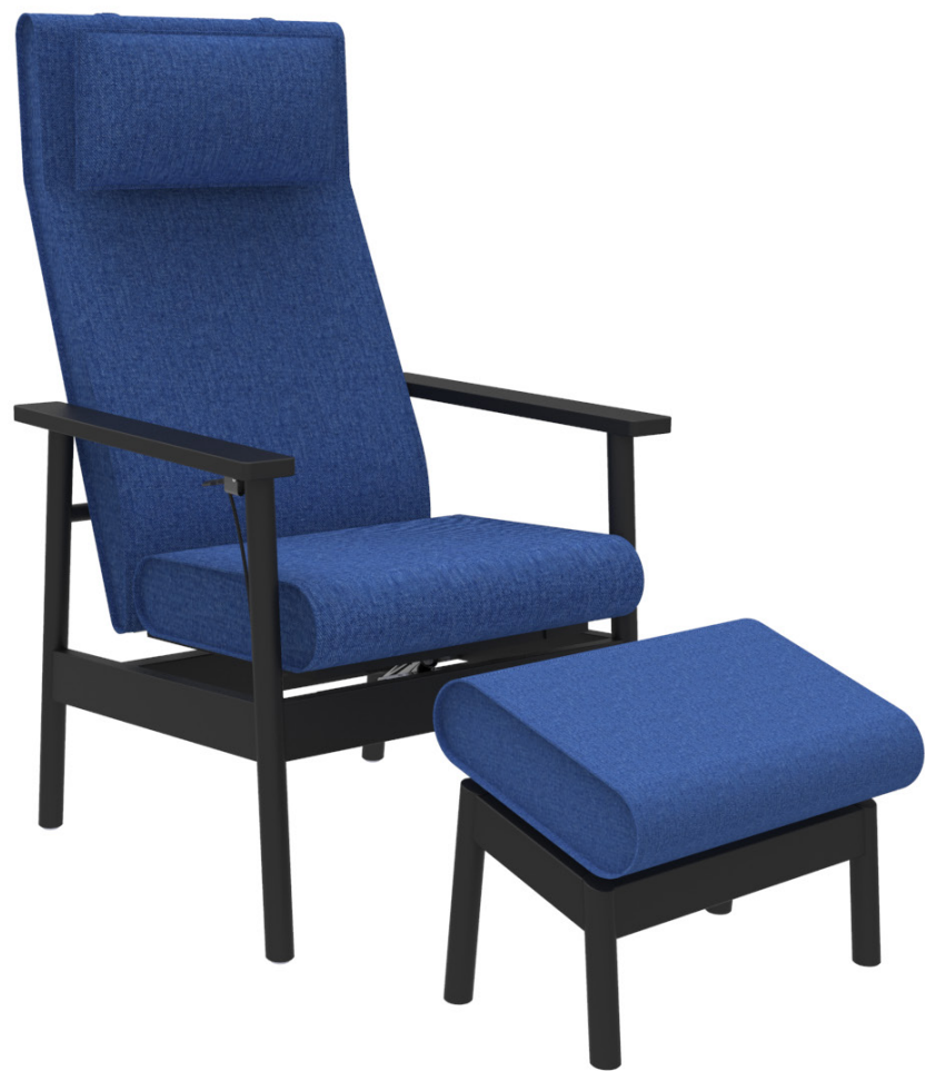
JACKIE DESIGN: PETER ANDERSSON